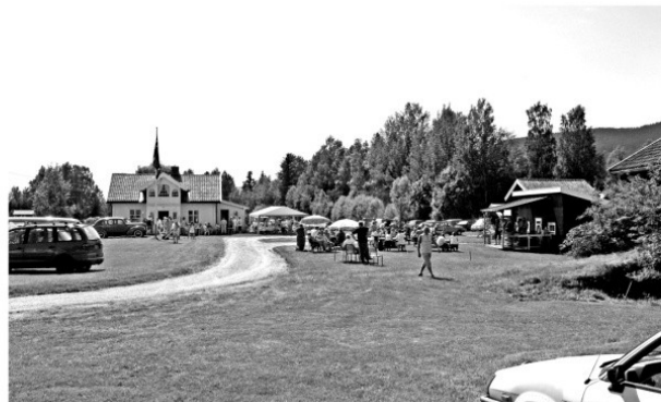
Fra Tundagen 2008.

Voksne. 1. Ivar Hansen 10 poeng 2. Vegard Grønnerud 12 poeng