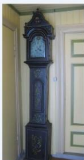
Golvklokka fra 1770 på Brudal